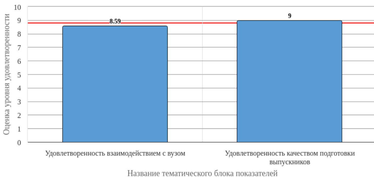
Рисунок 2.1 - Средняя оценка удовлетворенности (по тематическим блокам показателей)

Средняя оценка удовлетворенности респондентов по блоку вопросов «Удовлетворенность взаимодействием с вузом» равна 8.59, что является показателем высокого уровня удовлетворенности (75-100%).